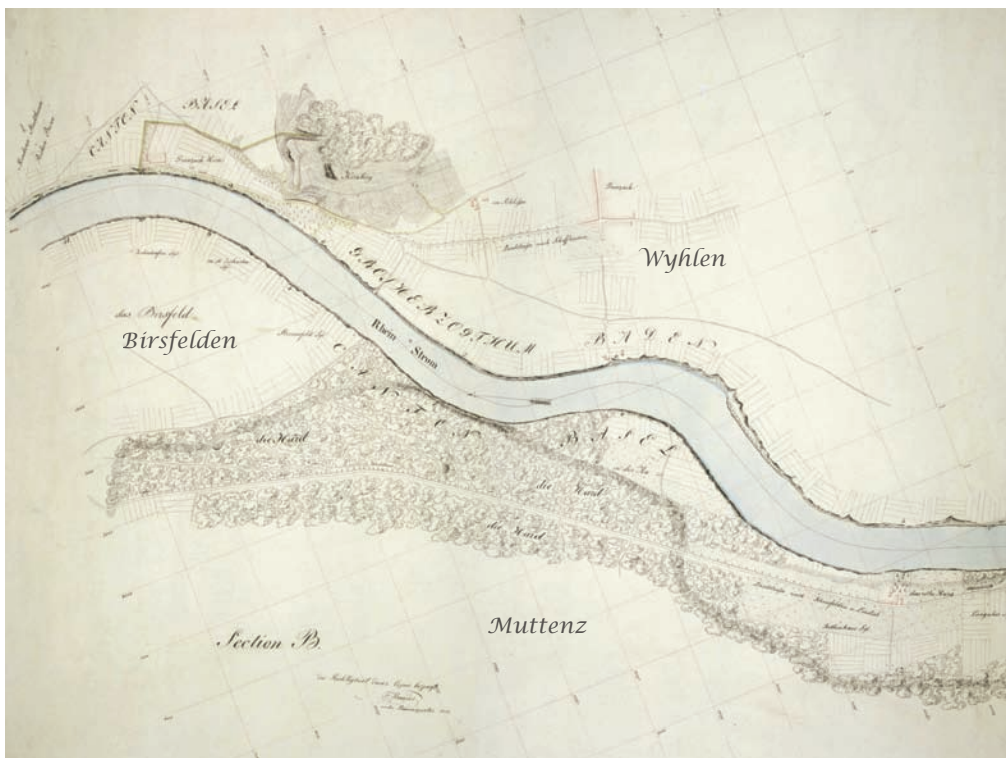
Karte aus dem Staatsarchiv BL

In der zweiten Phase wurden durch die Nachführungsgeometer alle Grundstücksgrenzen sowie die übrigen Informationsebenen der AV angepasst.