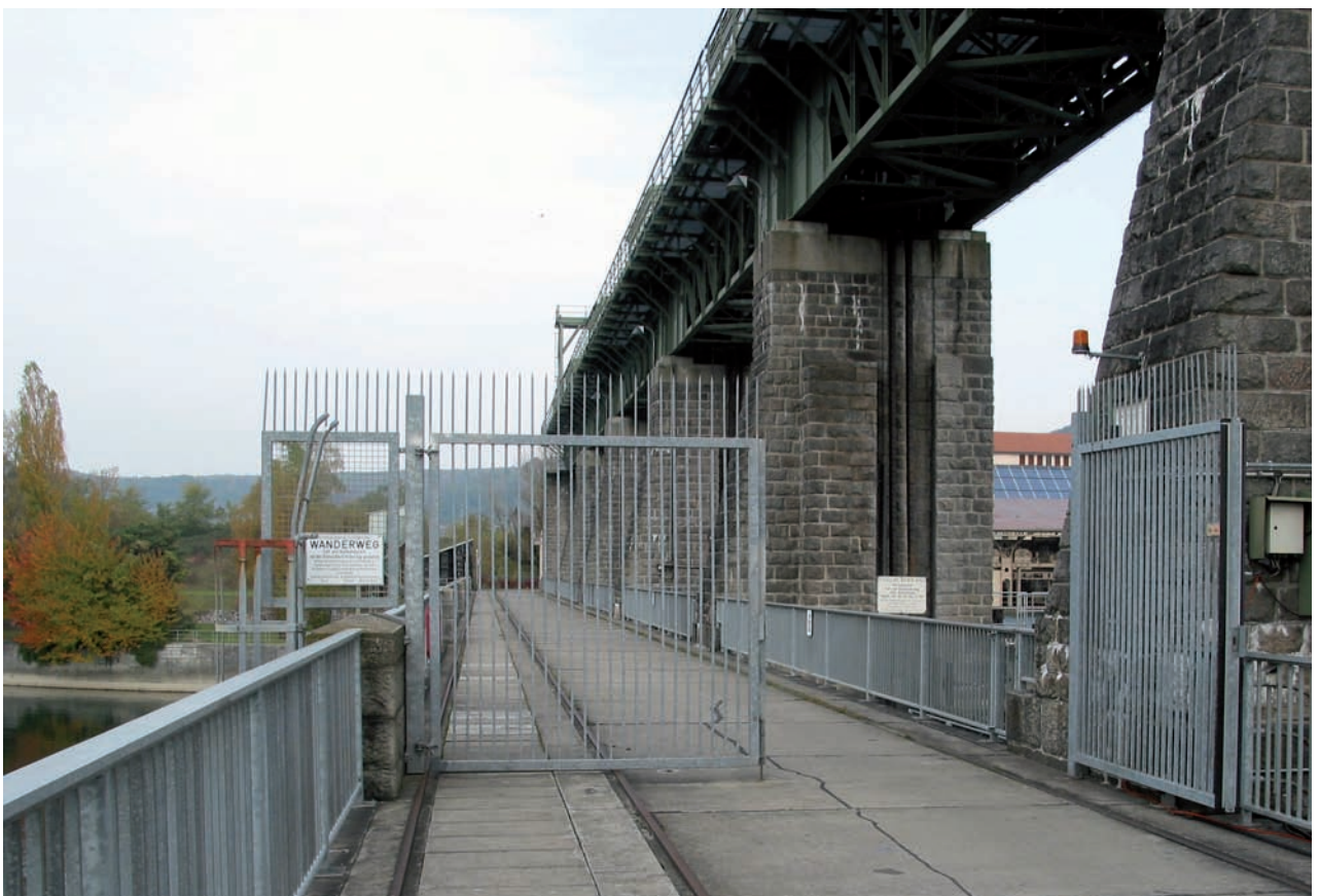
Grenztor Kraftwerk Augst / Wyhlen.

Eine spezielle Regelung der Landesgrenze wurde nie getroffen. Ende der sechziger Jahre bestanden zwar Bestrebungen im Bereich des Kraftwerkes, die Landesgrenze zu bereinigen. Diese scheiterten aber mit der Begründung, dass dies nur im Zusammenhang mit einer Regelung der Hochrheinschifffahrt von Basel bis zum Bodensee in Frage komme.