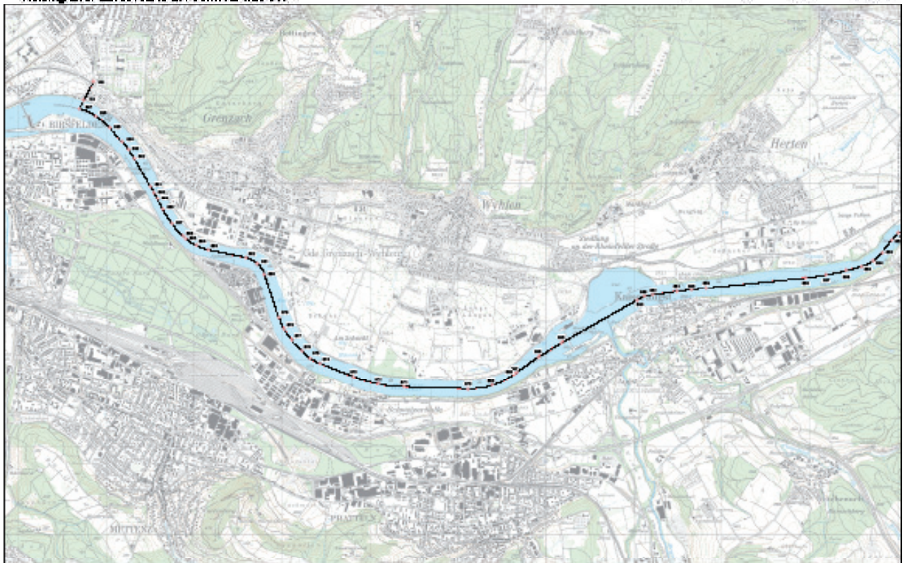
Karte © swisstopo